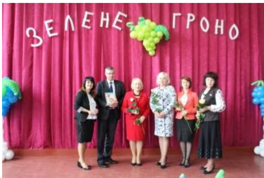
Журі конкурсу «Зелене гроно»