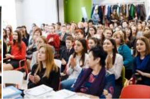
Учасники фестивалю- справжні шанувальники поезії